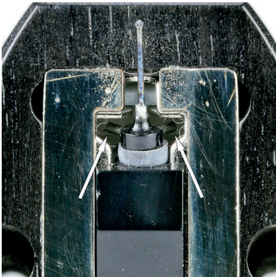
Ein besonders hoher Selektionsgrad der kräftigen Magnete (s. Pfeile) resultiert in absolut identischen Paarungen und einer „sportlichen“ Ausgangsspannung.

vorne, obwohl es nur im vermeintlich unterlegenen Thorens gehört wurde. Was habe ich in den letzten Wochen Geld in Vinyl investiert! Dem Hype um das schwarze Gold geschuldet findet sich mittlerweile alles, was mein Herz begehrt, im Sortiment der Mediawühl-tischmärkte. Da kauft man schon mal mehr frische Scheiben als geplant. Wer genau hat eigentlich den Gleichungssatz aufgestellt, MM-Systeme seien griffig und erdig, aber mit geringerer Auflösung und Feindynamik in der Performance; MC-Abnehmer dagegen genau umgekehrt in ihren Stärken und Schwächen? Vergessen Sie diese Vorurteile! Zumindest wenn Sie zu den Glücklichen gehören, die ein Clearaudio Charisma V2 mal in der eigenen Kette probieren dürfen. Dieser Abnehmer ▶